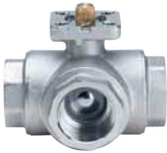
ART. S.1070 BALL•O•MATIC T-PORT